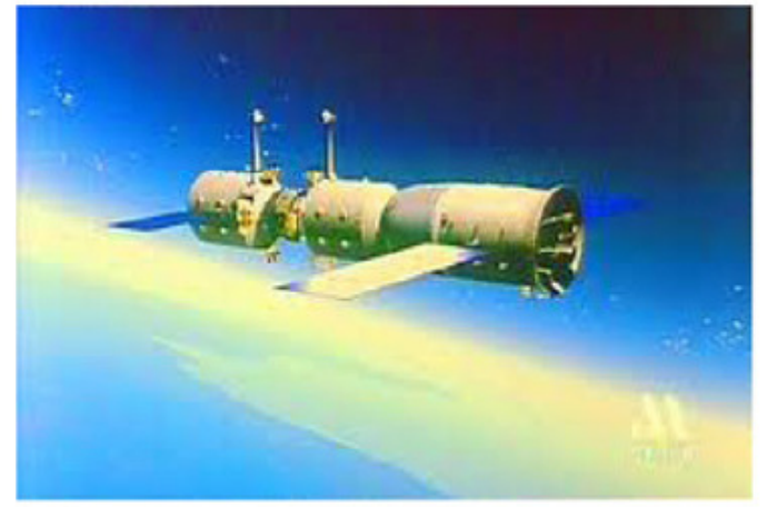
祝神舟7号舱对接成功, meiguohuaren发1500个包子